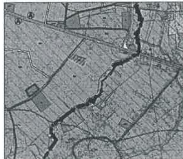
WYRYS ZE STUDIUM SKALA 1:10 000